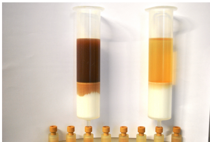
Figure 1 ▢ Exemple d'extraction SPE

où BC est la valeur du blanc mesurée après SPE (voir 4.5).